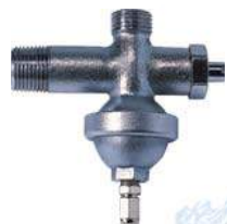
Amortiguador para Golpe de Ariete Estilo Angular